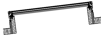
JET SKYSIGHT na podstawie JET ISO-THERM stromej; zastosowanie przy wystarczającym pochyleniu dachu