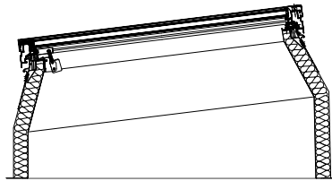
JET SKYSIGHT na podstawie JET ISO-THERM z pochyłem 7°